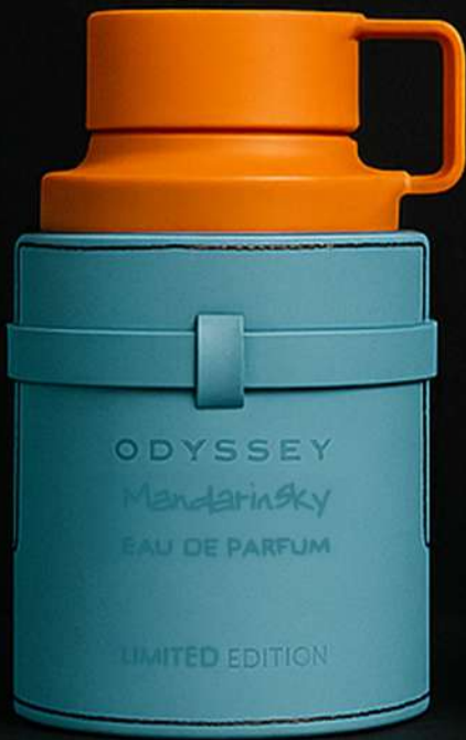
ODYSSEY MANDARIN SKY

Tres caminos, una misma esencia. Mandarin Sky brilla con la luz del día, Odyssey Homme fluye entre sol y noche, y Odyssey Candé despierta en la oscuridad con dulzura y misterio.